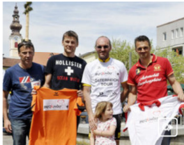
Am 30. Juni tricksen Kicker-Legenden im Dienste der guten Sache im Waldstadion Pasching.

Wann? 30.06.2012 18:00 Uhr Wo? waldstadion pasching, Poststraße 38, 4061 pasching