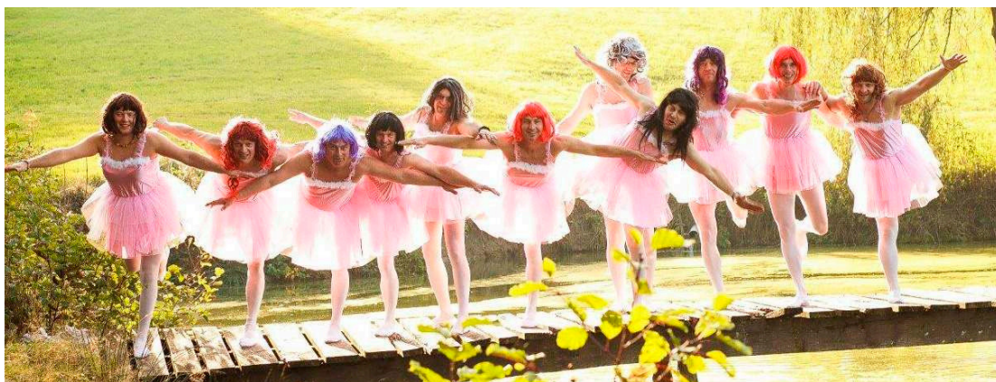
Die Grünen Jungs haben nichts, um ein pikant-lustiges Programm zu bieten.