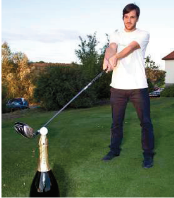
Winzer aus ganz Österreich golften für den guten Zweck.